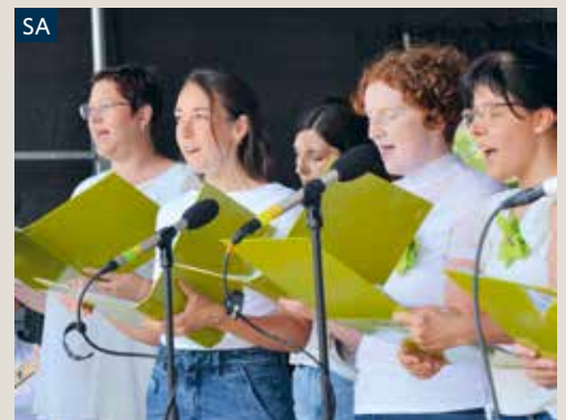
Chöretreffen mit neun ausgezeichneten Chören