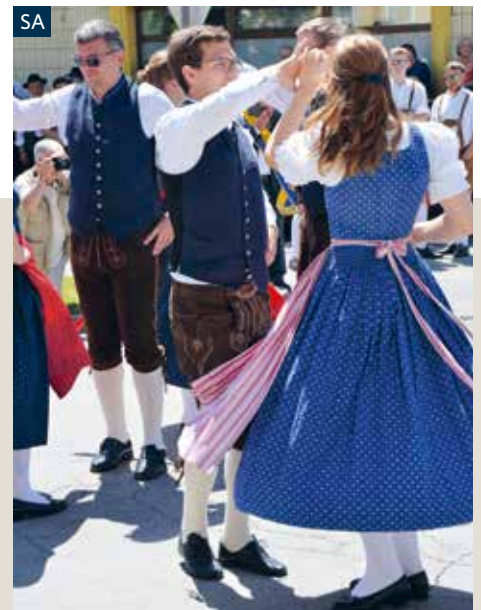
Volkstanzparade mit 12 Gruppen