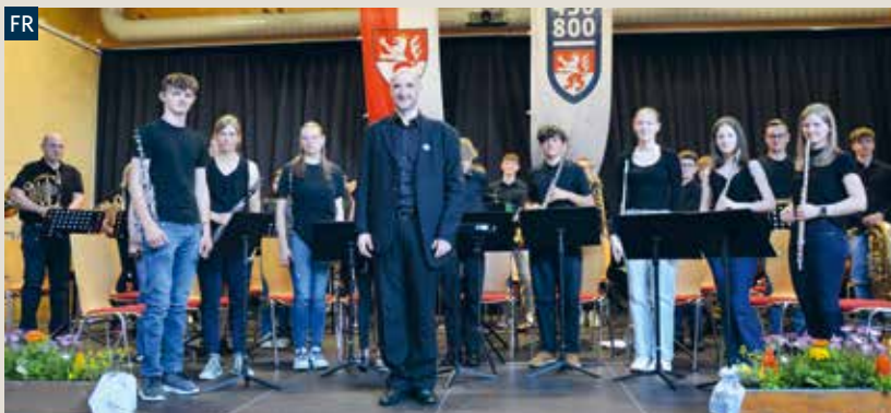
Schülerinnen und Schüler der Musikschule Ybbsfeld zeigten ihr Können bei der Eröffnung.