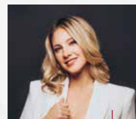
Samstag 22:00 Charlien