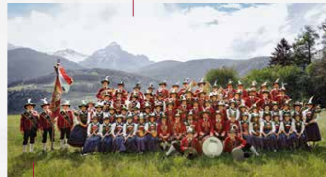
Samstag 19:00 Großer Zapfenstreich Bundesmusikkapelle und Schützenkompanie Matrei am Brenner