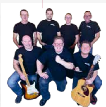
Samstag 22:45 Austropop meets Rock